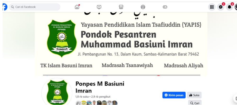
Gambar 1. Laman Facebook Pesantren M. Bsiuni Imran

Sementara itu, Facebook digunakan sebagai platform untuk membagikan informasi yang lebih lengkap dan terperinci. Di sini, pesantren dapat mempublikasikan artikel, pengumuman resmi, dan informasi terkait program pendidikan yang lebih mendalam. Selain itu, Facebook Groups dimanfaatkan untuk menjalin komunikasi dengan para alumni dan komunitas pesantren, yang dapat berbagi cerita, informasi, serta mengadakan diskusi tentang berbagai topik keagamaan atau pendidikan. Hal ini membantu memperkuat ikatan antara pesantren dan para pendukungnya, menciptakan komunitas online yang aktif dan mendukung perkembangan pesantren.