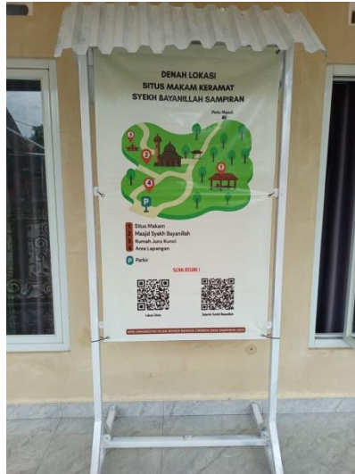
Gambar 14. Pembuatan denah informasi terkait Situs Syekh Bayanillah