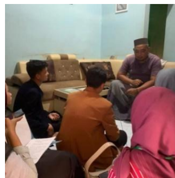
Gambar 5. Wawancara dengan ketua POKDARWIS Desa Sampiran