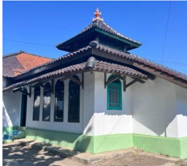
Gambar 2. Masjid Agung Syekh Bayanillah

biasa, baik berupa situs makam Syekh Bayanillah itu sendiri serta peninggalan sejarah lainnya. Membuat desa ini memiliki peluang ekosistem ekonomi kreatif yang berpotensi mendorong kesejahteraan masyarakat sekitar. Wilayah situs sendiri bisa dikembangkan dengan upaya penyediaan tempat parkir yang strategis, penataan ruang terbuka bagi UMKM yang menjual berbagai kebutuhan peziarah, serta pemandu wisata untuk mengenalkan sejarah perjalanan dan juga peninggalan dari sosok Syekh Bayanillah.