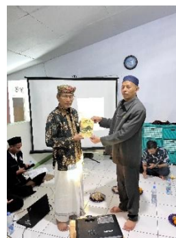
Gambar 12. Serah terima buku sejarah yang berjudul “ Jejak wali di tanah Sampiran, Sejarah dan warisan Syekh Bayanillah dari Dosen Pembimbing Lapangan kepada Kuwu desa Sampiran