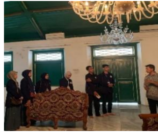
Gambar 9. Wawancara dengan humas luar Keraton Kanoman dan tokoh adat Kanoman