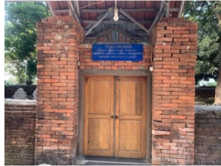
Gambar 3. Pintu pertama Situs Syekh Bayanillah