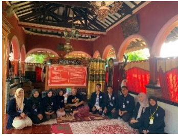
Gambar 8. Wawancara dengan juru kunci Situs Mbah Kuwu Sangkan