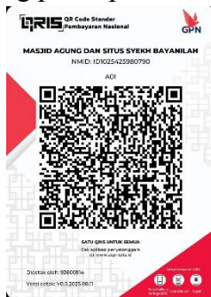
Gambar 17. QR Code Filantropi Situs & Masjid Agung Syekh Bayanillah

Selain itu, keberadaan media filantropi ini berkolaborasi dengan pengelola Masjid Agung Syekh Bayanillah yakni Ustadz Abdul Kodir sebagai upaya menjalankan amanah umat dengan transparansi penggunaan dana yang dijaga dengan laporan keuangan yang mudah diakses publik, sehingga membangun kepercayaan dan mendorong partisipasi filantropi berkelanjutan.