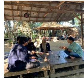
Gambar 10. Wawancara dengan sejarawan pengkaji naskah kuno dan pustakawan Keraton Kanoman

Berdasarkan hasil riset dan informasi yang didapat, melalui tahapan metode ABCD yang telah dilakukan mulai dari observasi langsung, wawancara mendalam dengan para tokoh masyarakat, hingga penelusuran historis ke berbagai situs yang terkait, penulis berupaya merekam dan menyusun kembali jejak sejarah serta nilai-nilai luhur yang diwariskan Syekh Bayanillah. Informasi tersebut diubah dalam bentuk naskah yang kemudian disusun menjadi buku mengenai sejarah Syekh Bayanillah dengan judul “Jejak Wali di Tanah Sampiran, Sejarah dan Warisan Syekh Bayanillah”.