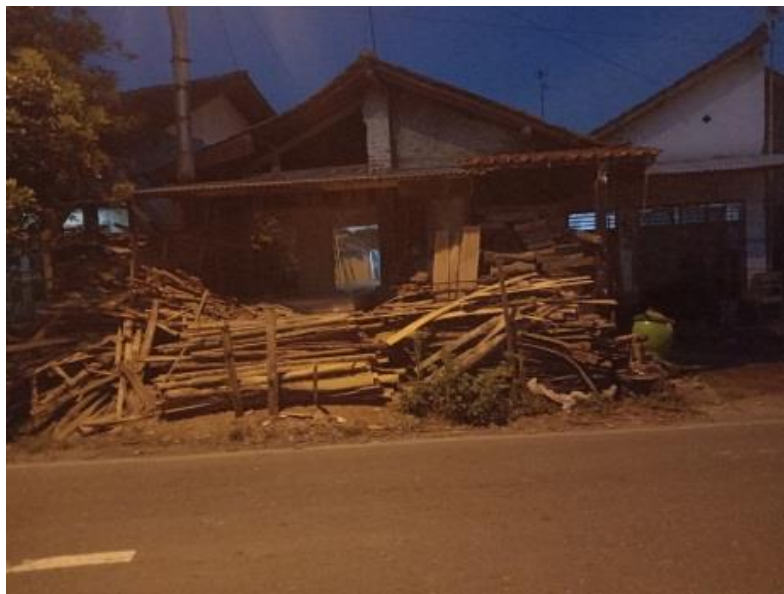
Gambar 2. Home Industry Mebel Desa Balapulang Wetan