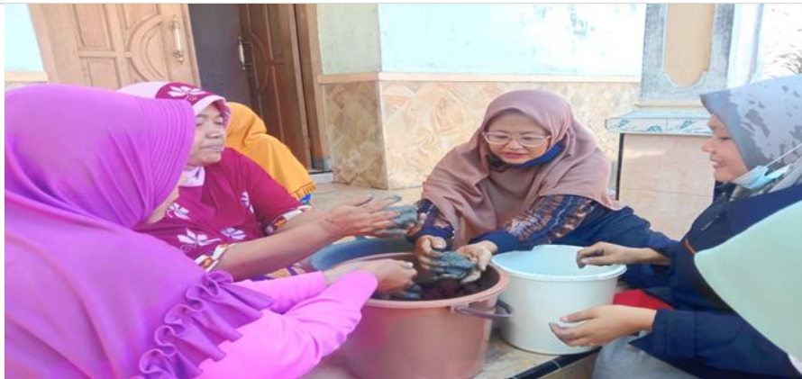
Gambar 5. Pelatihan Pembuatan Telur Asin