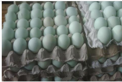
Gambar 1. Telur bebek

Dalam melakukan pemilihan telur bebek yang baik adalah telur bebek yang masih segar, telur harus bersih dari kotoran dan telur harus sempurna; masih utuh dan tidak retak sama sekali. Pemilihan telur bebek yang tidak busuk akan menghasilkan kualitas telur asin yang bagus (Salim, Syam, & Wijaya, 2018).