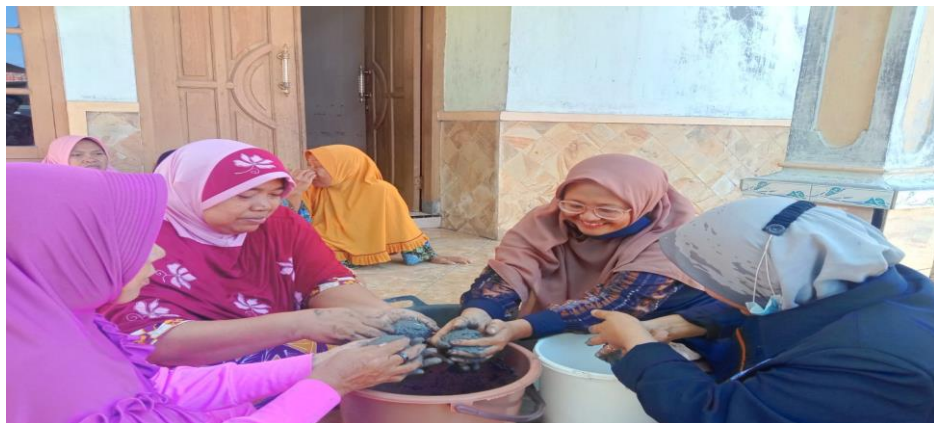
Gambar 5. Proses pembungkusan telur bebek dengan abu gosok