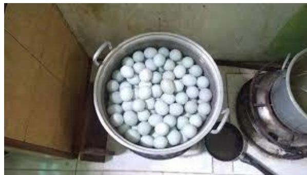
Gambar 2. Rebus telur bebek