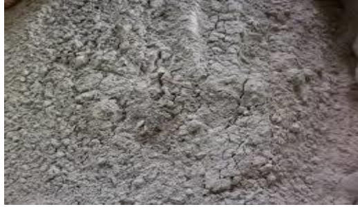
Gambar 4. Abu gosok yang dicampur dengan garam

Pemberian abu gosok dan serbuk bata merah tidak memberikan perbedaan yang mendasar terhadap rasa, tekstur juga kadar air tetapi ada perbedaan terhadap warna dan aroma telur asin (Ramli & Wahab, 2020).