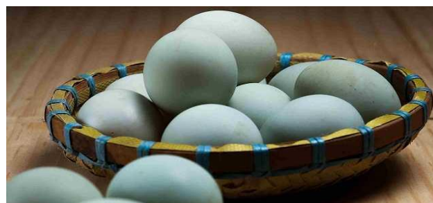
Gambar 3. Telur bebek ditiriskan setelah di rebus